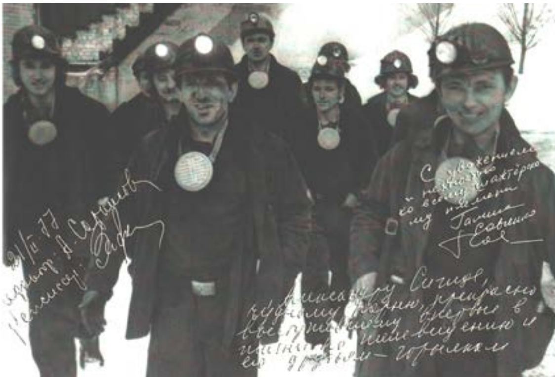
Шахтёрская бригада, 1977 год

подготовили трёх кандидатов в мастера спорта СССР, 39 спортсменов первого разряда, свыше 3,5 тысяч спортсменов массовых разрядов и около 4 тысяч значкистов БГТО, ГТО и ГЗР. Городской комитет по физкультуре и спорту с горкомом комсомола к 100-летию со дня рождения В. И. Ленина провёл спартакиаду по десяти видам спорта, в которой участвовало свыше 10 тысяч человек.