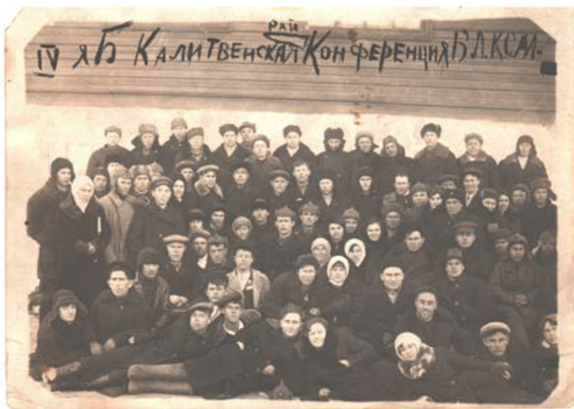
IV-я Белокалитвенская районная конференция ВЛКСМ