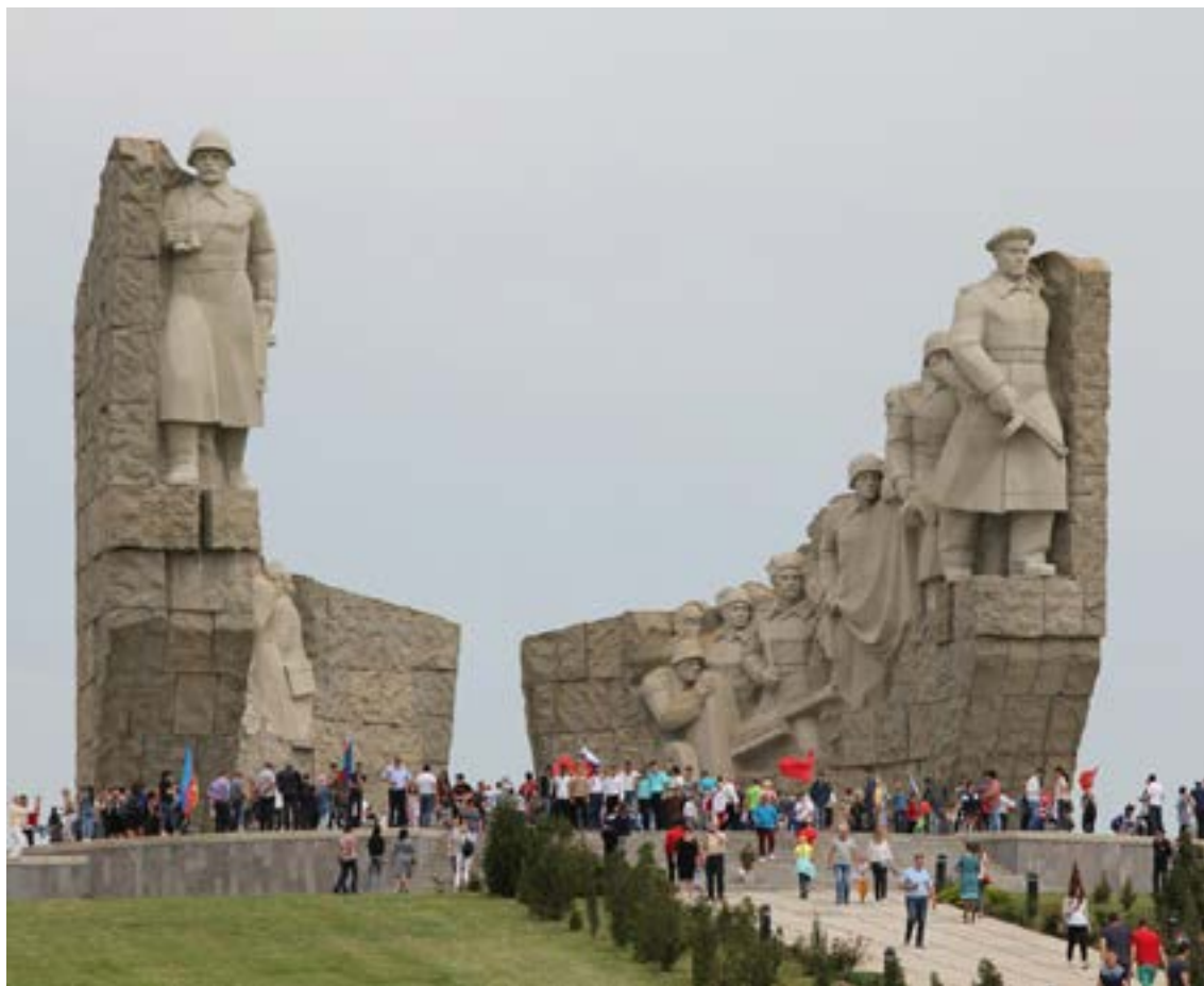
Мемориальный комплекс «Самбекские высоты»